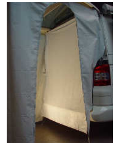
Sicht- / Spritzschutz optional erhältlich